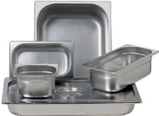
BANDEJAS GASTRONORM VARIOS TAMAÑOS 10,00 €