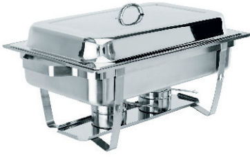
CHAFING DISH 35,00 €