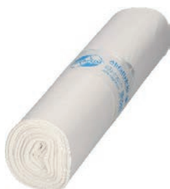
SACOS DE BASURA 70-100L 2,00 €