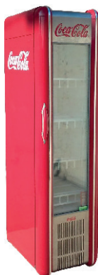
NEVERA VINTAGE COCACOLA 150,00 €