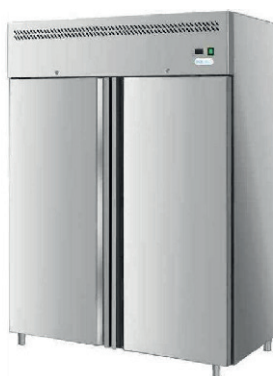
NEVERA INDUSTRIAL DOS PUERTAS 250,00 €