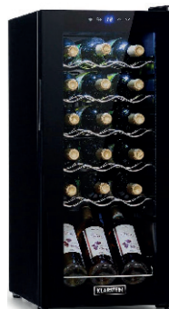
NEVERA PARA VINOS 180,00 €