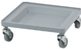
CARRO DE TRANSPORTE PARA CESTAS DE LAVADO HASTA 159KG 15,00 €