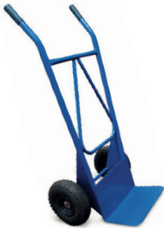
CARRETILLA 250KG 25,00 €