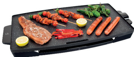
PLANCHA ELÉCTRICA ANTIADHERENTE