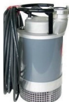
BOMBA DE AGUA PROFESIONAL GRANDE 280,00 €