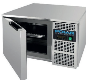
ABATIDOR DE TEMPERATURA 300,00 €