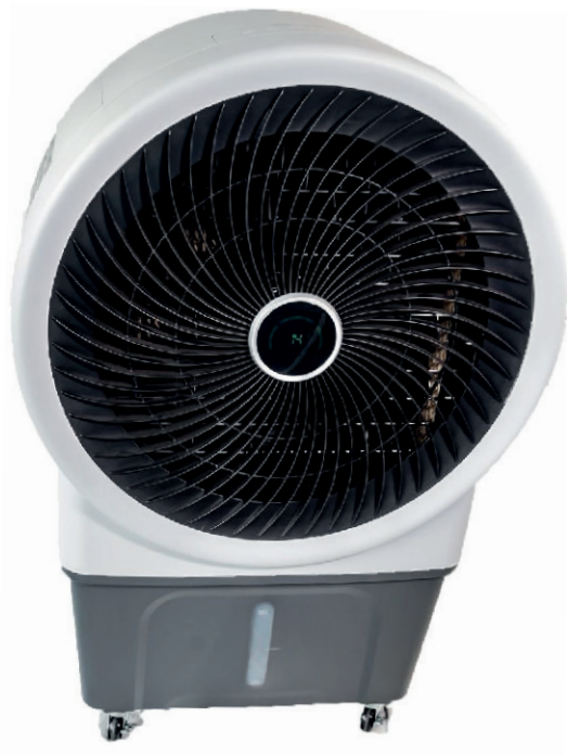
AIRE CLIMATIZADOR PURIFICADOR PORTÁTIL HASTA 400/500 M 2