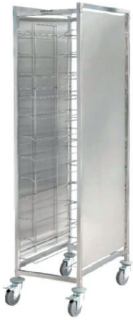
CARRITO PARA BANDEJAS 12 BANDEJAS 80,00 €