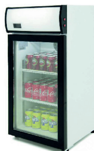
NEVERA PARA REFRESCOS 70,00 €