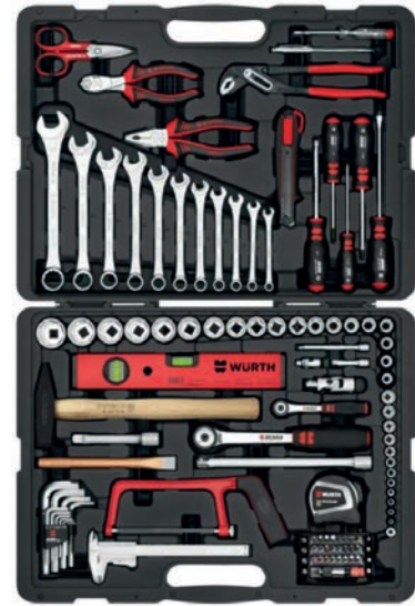
CAJA DE HERRAMIENTAS WURTH 91 PIEZAS 60,00 €