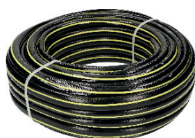
MANGUERA DE AGUA 20,00 €