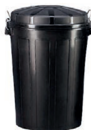
CUBO DE BASURA 70L 35,00 €