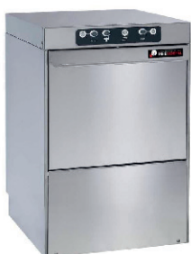
LAVAPLATOS INDUSTRIAL 150,00 €