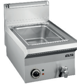
BAÑO MARÍA 85,00 €