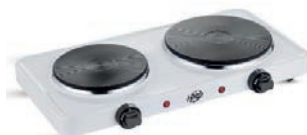
COCINA 2 FUEGOS A GAS 80,00 €