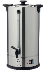
TERMO INDUSTRIAL 15L 90,00 €