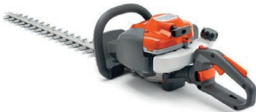
CORTASETOS 122HD60 HUSKVARNA 65,00 €