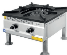
FOGÓN GAS 40,00 €