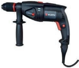
TALADRO WURTH 6 PUNTAS 70,00 €