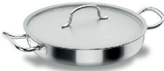
PAELLERA 1 METRO DE DIAMETRO 35,00 €