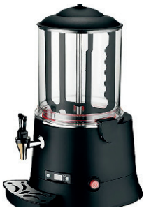
CHOCOLATERA 5L 80,00 €