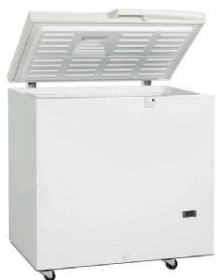
ARCÓN CONGELADOR 1,5 METROS 150,00 €