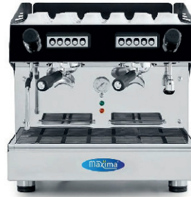
CAFETERA INDUSTRIAL COMPACTA 6,5L DE AGUA 200,00 €