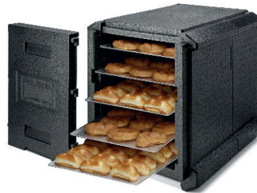
ARMARIO ISOTÉRMICO 60,00 €