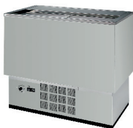
BOTELLERO INOXIDABLE 200L 150,00 €