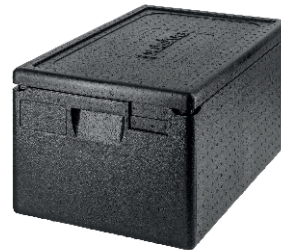
CAJA ISOTÉRMICA 30,00 €