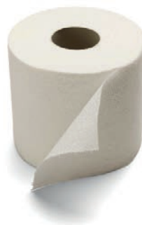
ROLLO DE PAPEL MECHA 2,00 €