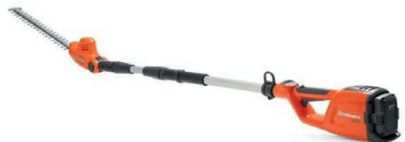
KIT CORTASETOS HUSKVARNA 65,00 €