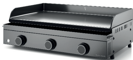
PLANCHA A GAS