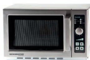
MICROONDAS 25,00 €