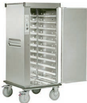
CARRITO CALENTADOR PARA BANDEJAS 260,00 €