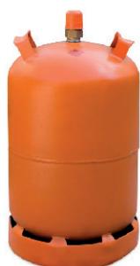
BOMBONA DE BUTANO 18,00 €