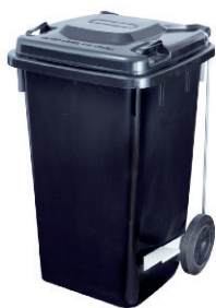
CUBO DE BASURA 100L 35,00 €