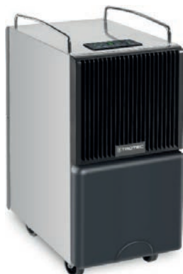
DESHUMIDIFICADOR 30L/DIA, DEPÓSITO DE 8L