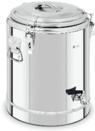
LECHERA ISOTÉRMICA CON GRIFO 22,5L 90,00 €