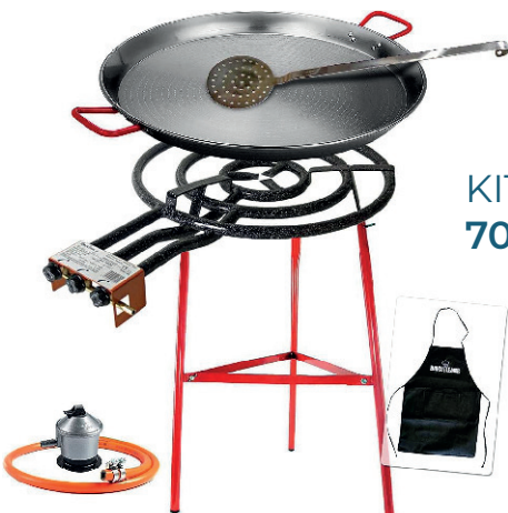
KIT PAELLERO 70,00 €