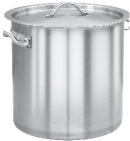
CAZUELA GRANDE 25,00 €