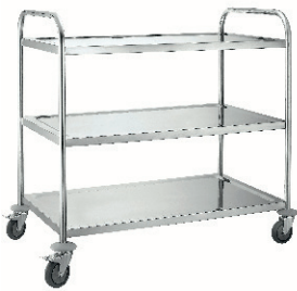
CARRITO DE SERVICIO 80,00 €