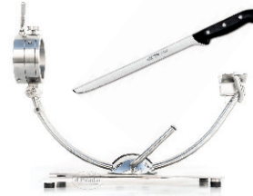
JAMONERO PROFESIONAL DE ACERO Y CUCHILLO JAMONERO 50,00 €