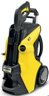
HIDROLIMPIADOR KARCHER 90,00 €