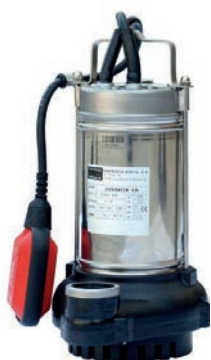
BOMBA DE AGUA DE AXHIQUE PEQUEÑA 130,00 €