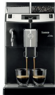
CAFETERA EXPRESSO SAECO LIRIKA 2,5L 90,00 €