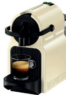
CAFETERA DE CÁPSULAS NESPRESSO DE'LONGHI INISSIA 60,00 €