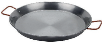
PAELLERA 20,00 €