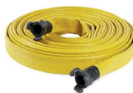
MANGUERA DE AGUA GRAN CAUDAL 40,00 €