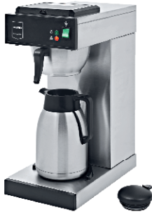
CAFETERA 2,3L DE AGUA 80,00 €