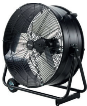
VENTILADOR INDUSTRIAL 330W