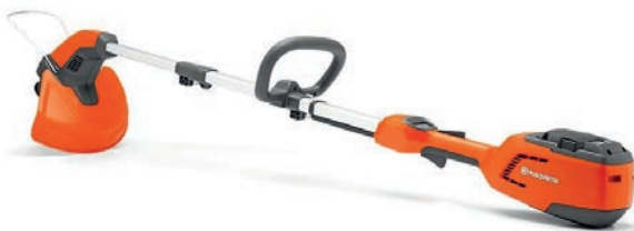
RECORTADORA 115IL HUSKVARNA 65,00 €