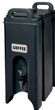
CONTENEDOR DE BEBIDAS 18L 40,00 €