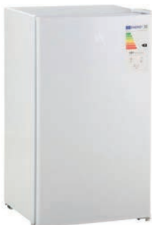
MINI NEVERA 91L 70,00 €