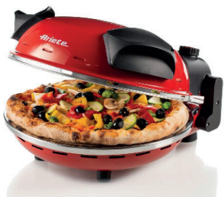
MINI HORNO PIZZERO