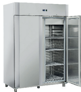
ARMARIO CALIENTE GASTRONORM 350,00 €