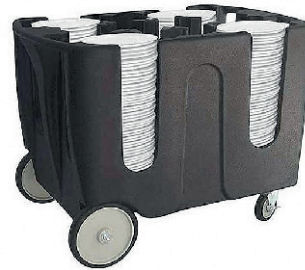
CARRO PORTA PLATOS 200/400 PLATOS 70,00 €