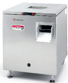
SECADORA ABRILLANTADORA DE CUBIERTOS 250,00 €