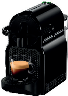
CAFETERA DE CÁPSULAS NESPRESSO DE'LONGHI INISSIA 60,00 €