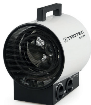
CALEFACTOR ELÉCTRICO 3000W