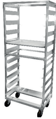
CARRITO PARA BANDEJAS 6 BANDEJAS 80,00 €