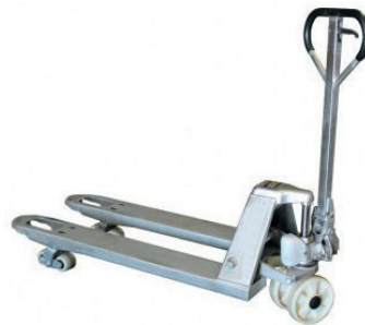
TRANSPALETA MANUAL GALVANIZADA 2500KG 90,00 €