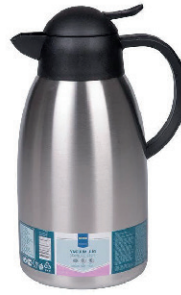
JARRA TÉRMICA 2L 10,00 €