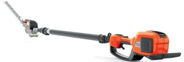
CORTASETOS HUSKVARNA 65,00 €